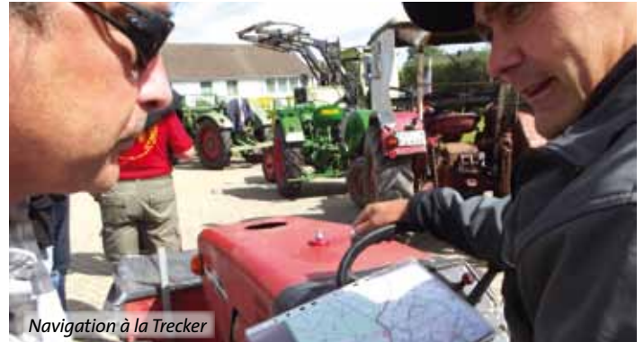
Navigation à la Trecker