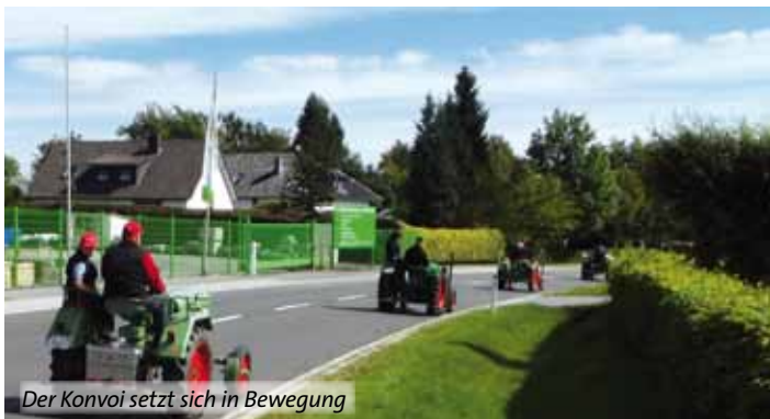
Der Konvoi setzt sich in Bewegung