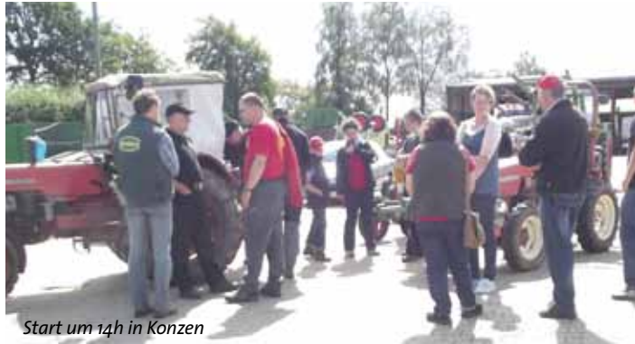
Start um 14h in Konzen