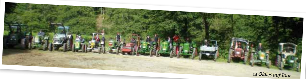
14 Oldies auf Tour

Dies war eine gute Idee, denn in diesem Jahr wurde deutlich weniger Asphalt unter die Räder genommen, stattdessen führte die Strecke teilweise über abgelegene Feldwege und durch den Wald. An einigen Steilstücken muss-